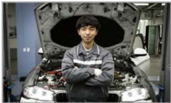
중앙일보 [ 중앙일보 ] 차 엔진이 교과서! 나는 '마스터' 꿈꾸는 19세 자동차 정비사입니다. (2017. 12. 01.)