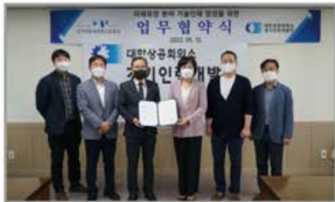
한국일보 [ 한국일보 ] 경기인력개발원 - 경기자동차과학고, 미래유망분야기술인재 양성 업무 협약 체결 (2022. 05. 18.)