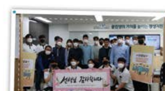
선생님과 나누는 마음! 스승의 날 만남!