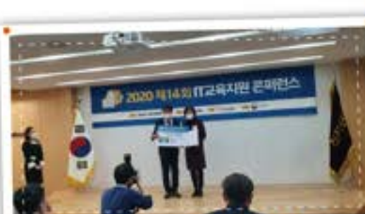
정보의 힘이 미래의 힘! IT 정보교육 우수상 수상!