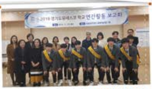
세계와 함께 걸어간다! 유네스코협력학교!