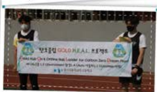
지구를 살리는 탄소중립선서!