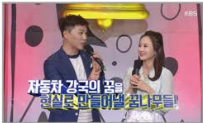
도전 골든벨 [ KBS ] 2TV 도전 골든벨 (2016. 04. 03.)