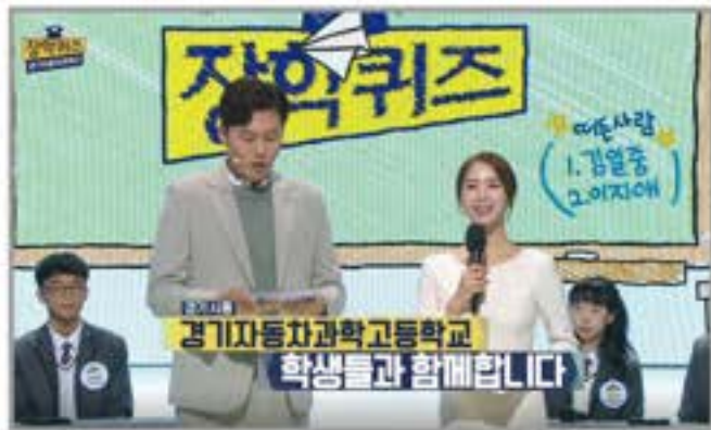
[ 장학퀴즈 ] 장학퀴즈 (2020. 05. 24.) 경기자동차과학고등학교 학생들과 함께합니다