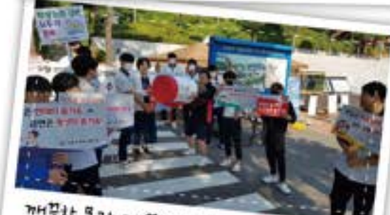
깨끗한 물과 깨끗한 마음! 세계를 깨끗하게!