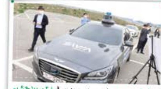
자율주행자동차를 먼저 만나다! K-City 체험!