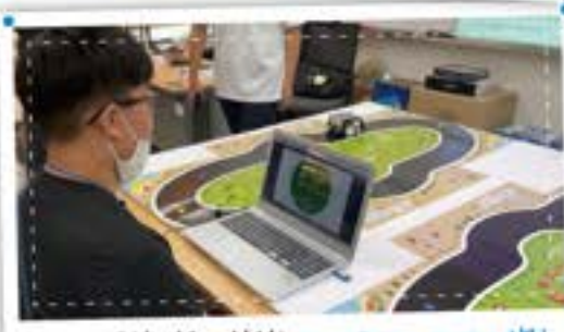
재능 뽐뿌! 실력뽐뿌! GHAS ON 페스티벌!