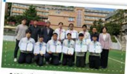
2022 기능경기대회 자동차 부문 최다수상!