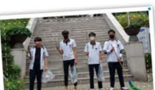
지속가능 환경을 만들자! 플로깅 챌린지!