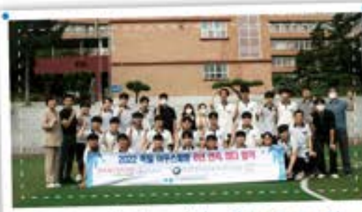
6년간 아우스빌동 전국 최다합격(109명!)