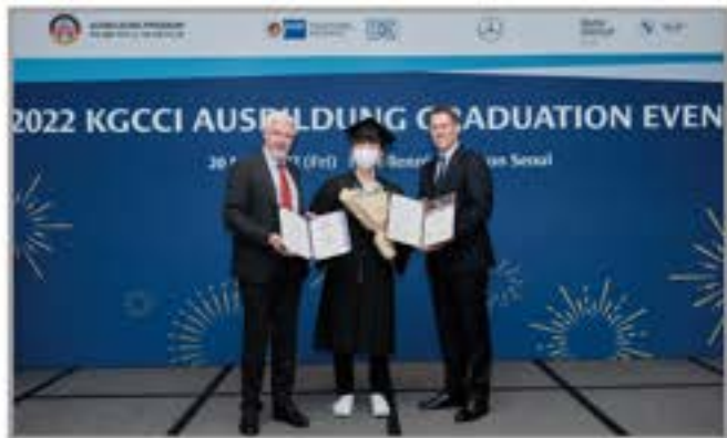
아시아경제 [ 아시아경제 ] 자동차 정비 실무이론 배우는 '아우스빌둥' 첫 졸업생 배출 (2022. 05. 23.)