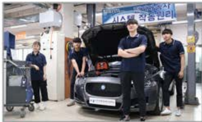
전자신문 [ 전자신문 ] 취업 걱정없는 명품학교 - 경기자동차과학고등학교 (2022. 06. 12.)