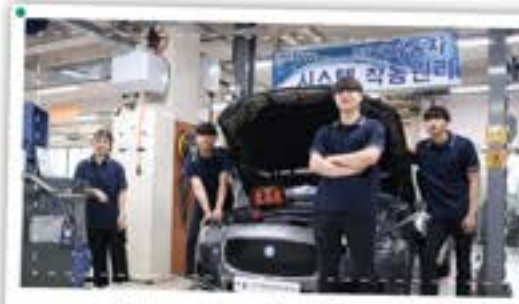
미래자동차라면서 만나세요! 전기자동차!