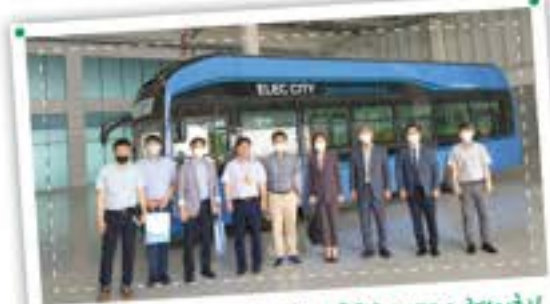
서울대에서 먼저 알아본 자율주행센터 협약회!