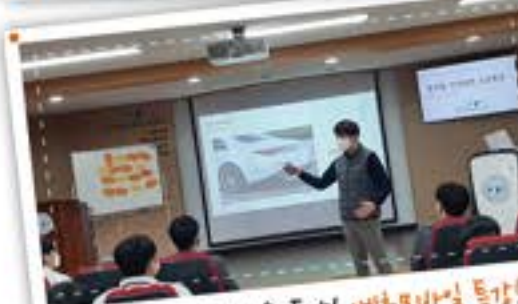
최고의 기업에서 온 특강! 벤츠모바일 특강!