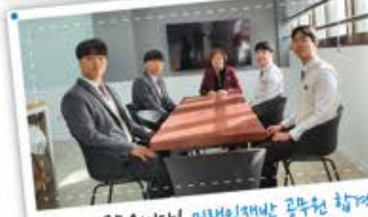
우리는 공무원이야! 미래인재반 공무원 합격!