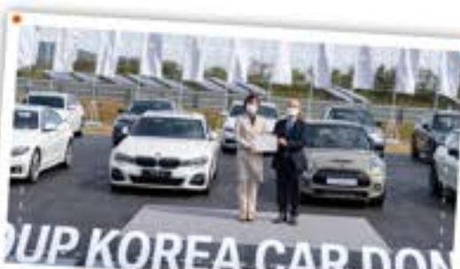
우수 기업이 먼저 신뢰하고 지원! BMW 차량기증!