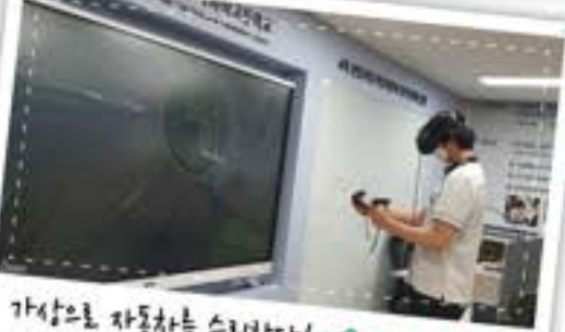
가상으로 자동차를 수리한다! VR/AR 전문가!